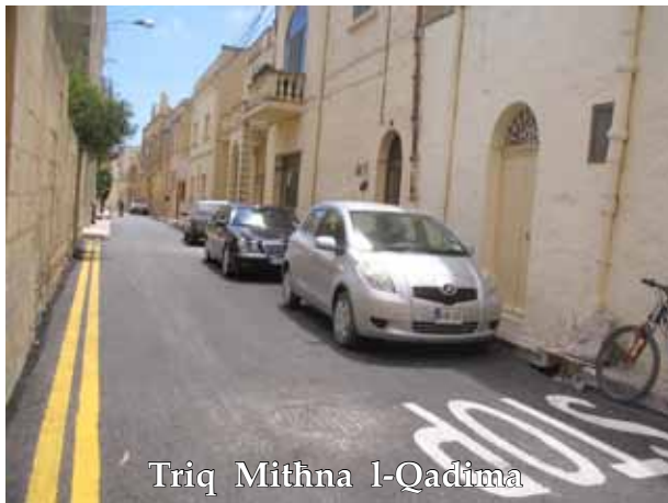
Triq Mithna l-Qadima

Triq Sant' Indirja u Triq Xjuf ir-Rih sar ukoll xogħol relatat mal-kumpanija Go. Sa issa saru bit-tarmak- Triq Grunju, Triq Mithna l-Qadima, Triq Karlu Borg u parti minn Triq Dun Grezz. Fil-xhur li ġejjin se jkompli għaddej ix-xogħol tat-tarmak li b'kollox se jiġi jiswa €500,000. Meta jitlesta ix-xogħol inkunu wettaqna hidma estensiva fuq it-toroq tagħna.