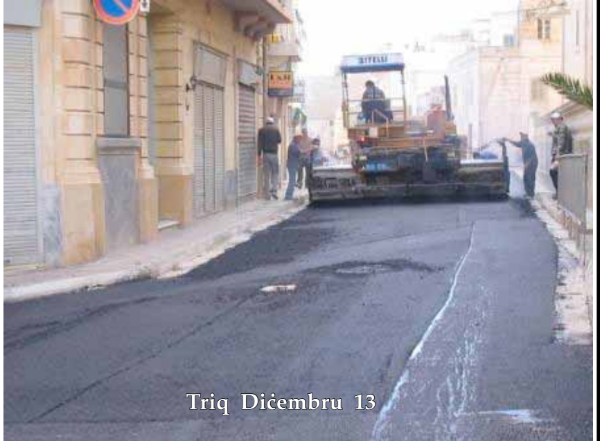
Triq Dicembru 13

Kien xieraq li t-triq prinċipali tar-raħal tingħata 'face lift'. Kien għalhekk li f'Ottubru 2010 beda x-xogħol biex jinbidlu s-servizzi ta' l-ilma fit-triq halli mbaġhad ikun jista' jingħata t-tarmak. Matul il-hidma fuq it-triq Itqajna ma' xi intoppi li riedu jiġu solvuti. Illum nistgħu ngawdu triq oħra twila li nksiet bit-tarmak. Ta' min jgħid lil din it-triq giet tiswa 70,000 euros. Dan barra x-xogħol li l-korporazzjoni tal-ilma u tad-dawl għamlet għas-spejjes tagħha.