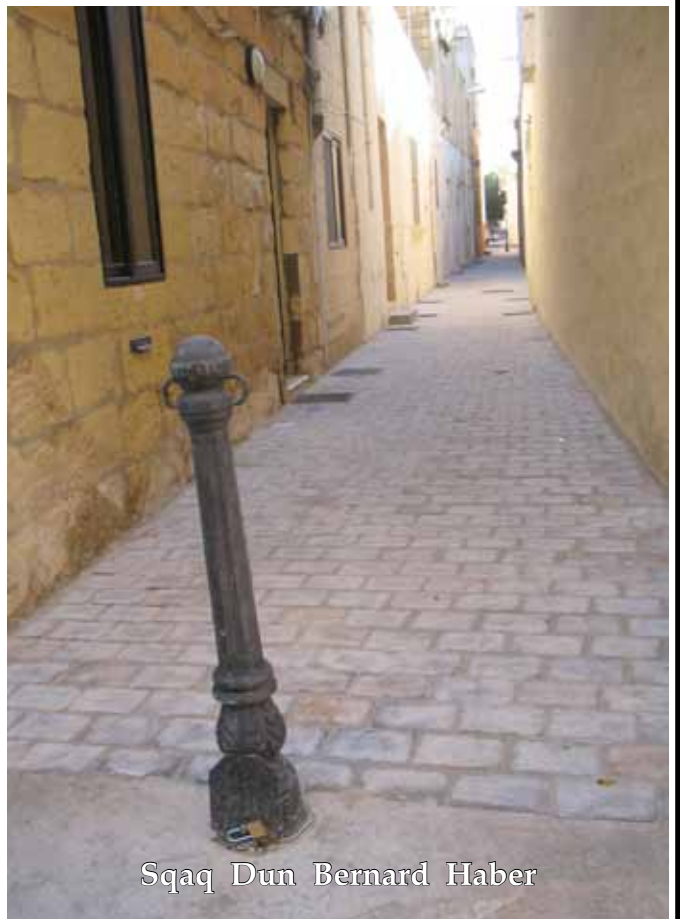
Sqaq Dun Bernard Haber

U la qed nitkellmu fuq UIF, il-kunsill għadu kemm lesta proġett ieħor ta' tisbiih fil-lokalita'. Dan huwa l-isqaq li jgħaqqad Triq Cicciano ma' Triq Dun Bernard. Dan l-isqaq huwa wieħed mill-ftit trejqiet antiki li jinsabu fil-qalba tar-raħal. Permezz tal-fondi mill-Urban Improvement Funds fi hdan il-MEPA, dan l-isqaq inkasa bil-madum porfido, twaħħlu żewg bollards u tpoġġew żewg qsari.